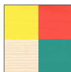
Farbe nach wahl